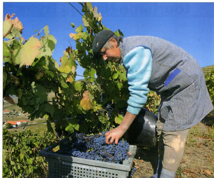
Fin septembre, les vendanges se déroulent toujours manuellement dans le domaine de Quinta Nova.