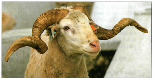
Un mouton bordeleka, une espèce protégée présente au nord du Portugal.