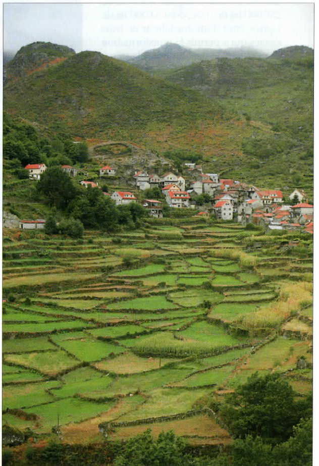
Des paysages pittoresques situés au cœur du parc national de Peneda-Gerês.

ne chère et belles pistes dans le parc Peneda-Gerês